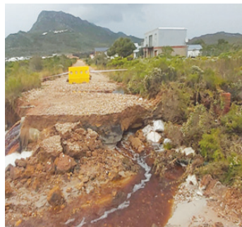
Lakeside-weg, Bettysbaai – Gedeelte van pad weggespoel